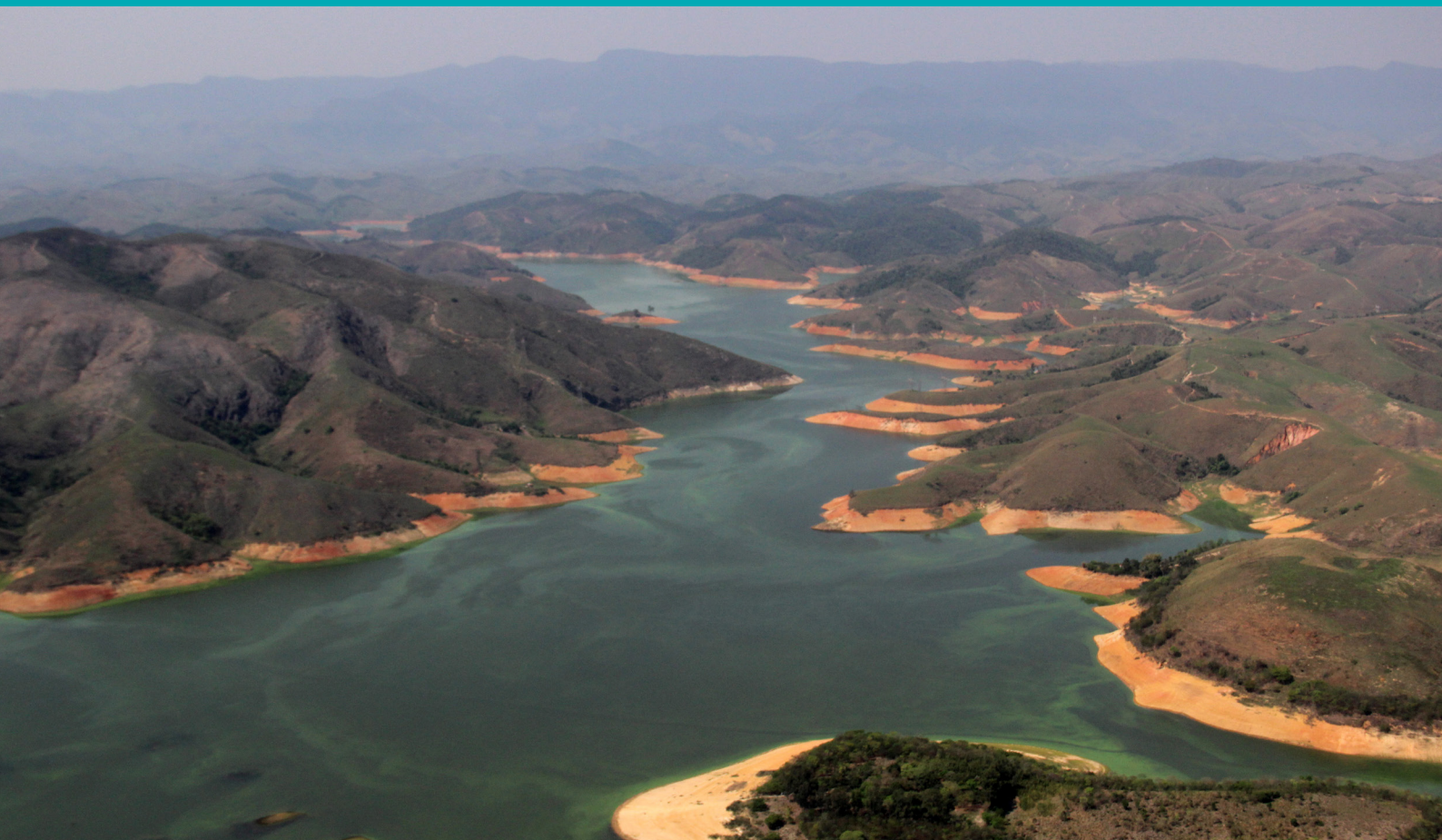
Reservatório do Funil, em Itatiaia/RJ

A Agência Nacional de Águas e Saneamento Básico (ANA) publicou no Diário Oficial da União, no dia 22 de dezembro de 2023, a Resolução ANA nº 172/2023, que estabelece os Preços Públicos Unitários (PPUs) a serem cobrados pelos usos de recursos hídricos de domínio da União realizados em 2024. A norma está em vigor desde o dia 1º de janeiro de 2024 e apresenta os novos valores para as bacias hidrográficas dos rios Paraíba do Sul; Piracicaba, Capivari e Jundiá; São Francisco; Doce; Paranaíba; Verde Grande e Grande.