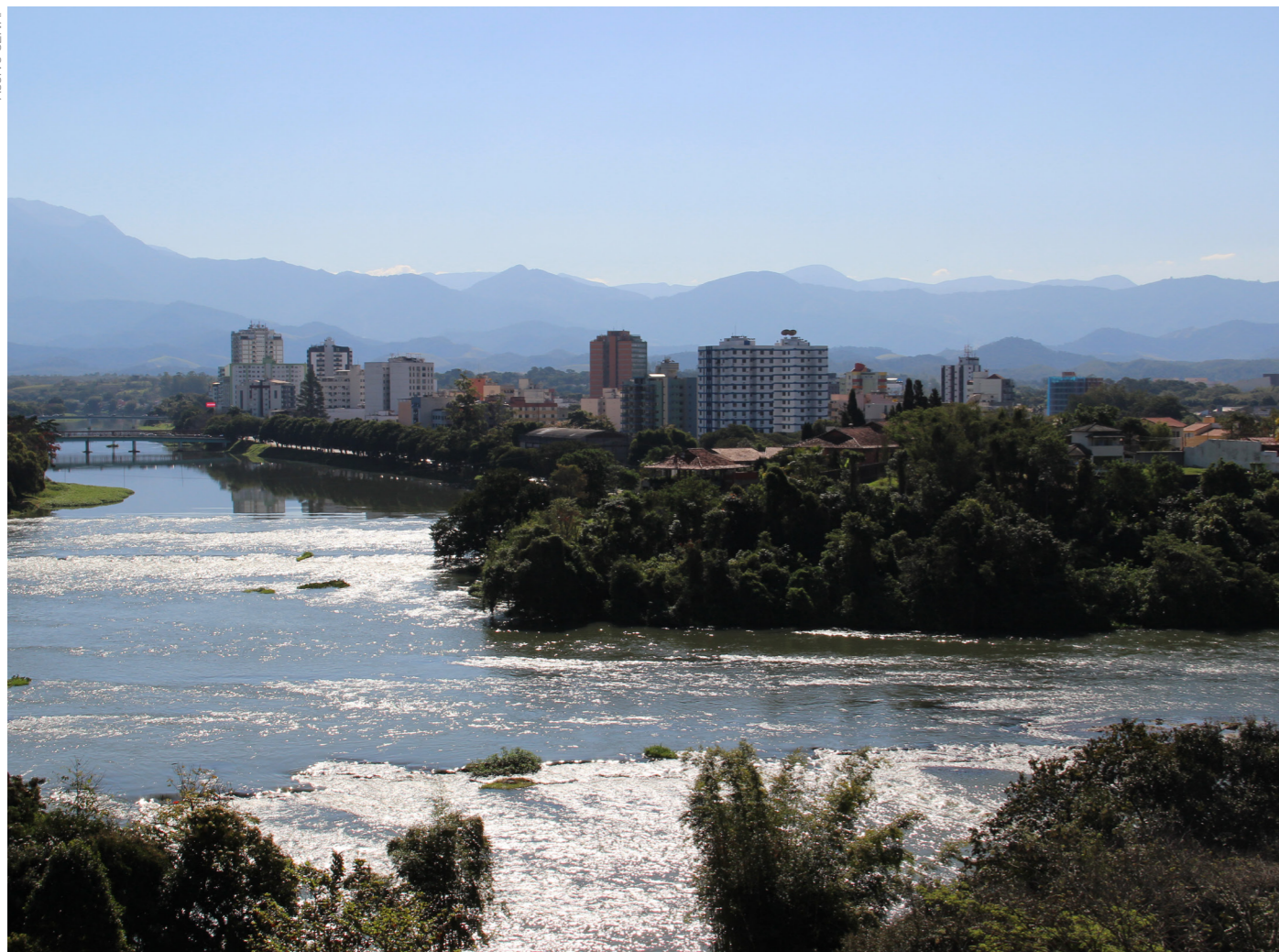
Trecho do rio Paraíba do Sul na cidade de Resende/RJ.