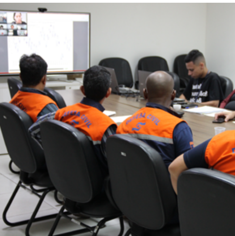
GTAOH foi instituído no ano de 2005