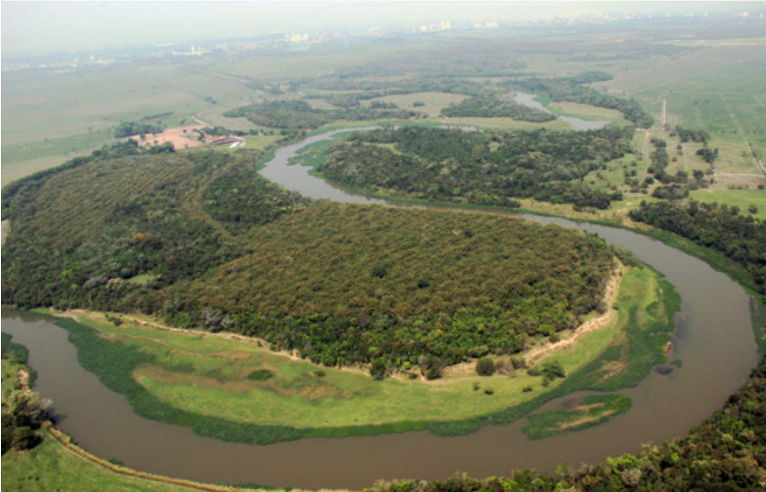
Trecho do rio Paraíba do Sul na área paulista

O ano de 2019 foi encerrado com uma importante conquista: a aprovação do Programa de Investimento em Serviços Ambientais para Conservação e Recuperação de Mananciais na área da bacia hidrográfica do rio Paraíba do Sul. Nos próximos 15 anos, o Comitê investirá R$ 84 milhões em ações voltadas para o incremento da disponibilidade hídrica e a melhoria da qualidade das águas do Paraíba do Sul e afluentes. A expectativa é que o programa seja desenvolvido em parceria com os sete comitês afluentes.