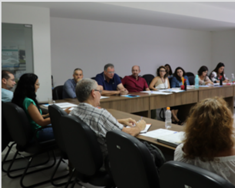
Próxima reunião está prevista para março